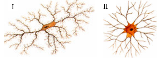
LINHARES, S.; GEWANDSZNAJDER, F. Biologia Hoje .

6) (UFRRJ 2002) Na figura abaixo estão representadas duas células, que no tecido nervoso estão associadas aos neurônios e desempenham funções importantes.